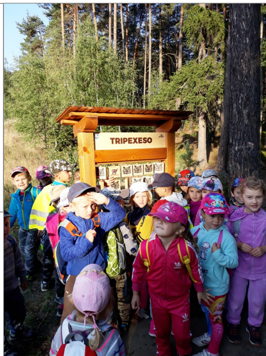
Děti z mateřské školy u jednoho z didaktických panelů na naučné stezce.